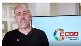
UNAI SORDO Secretario General de CCOO

Esperamos que esta guía sea una herramienta eficaz para incrementar la sensibilización y el conocimiento del mundo sindical en relación a la Agenda 2030 y sus ODS y para ayudar a la acción sindical en este marco, con el objetivo de colaborar en la consecución de sus fines.